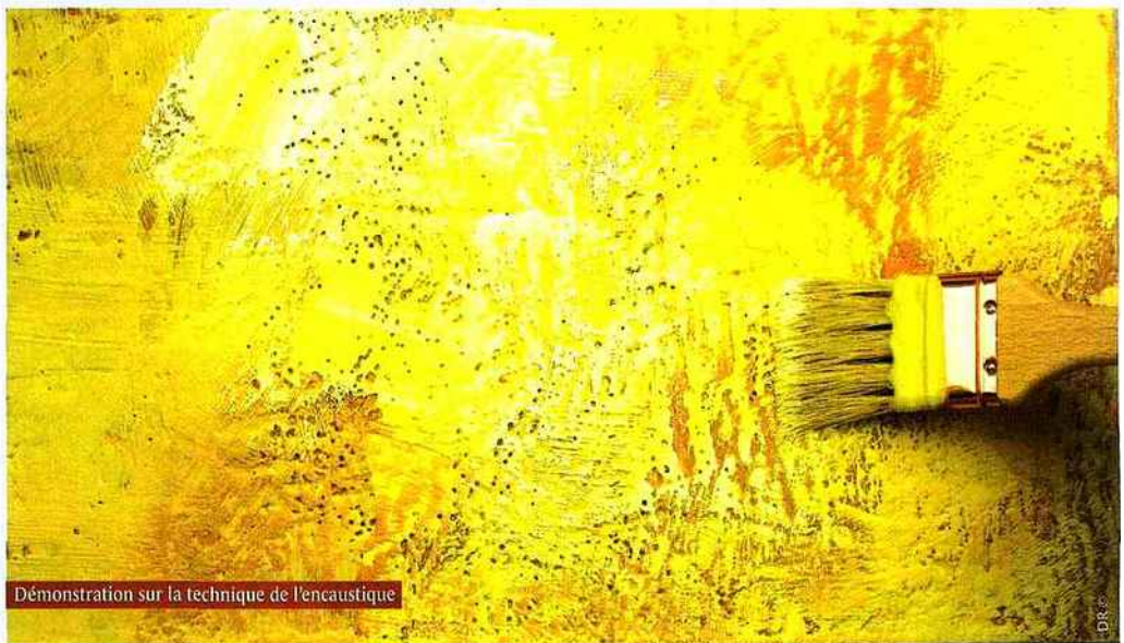
Démonstration sur la technique de l'encaustique