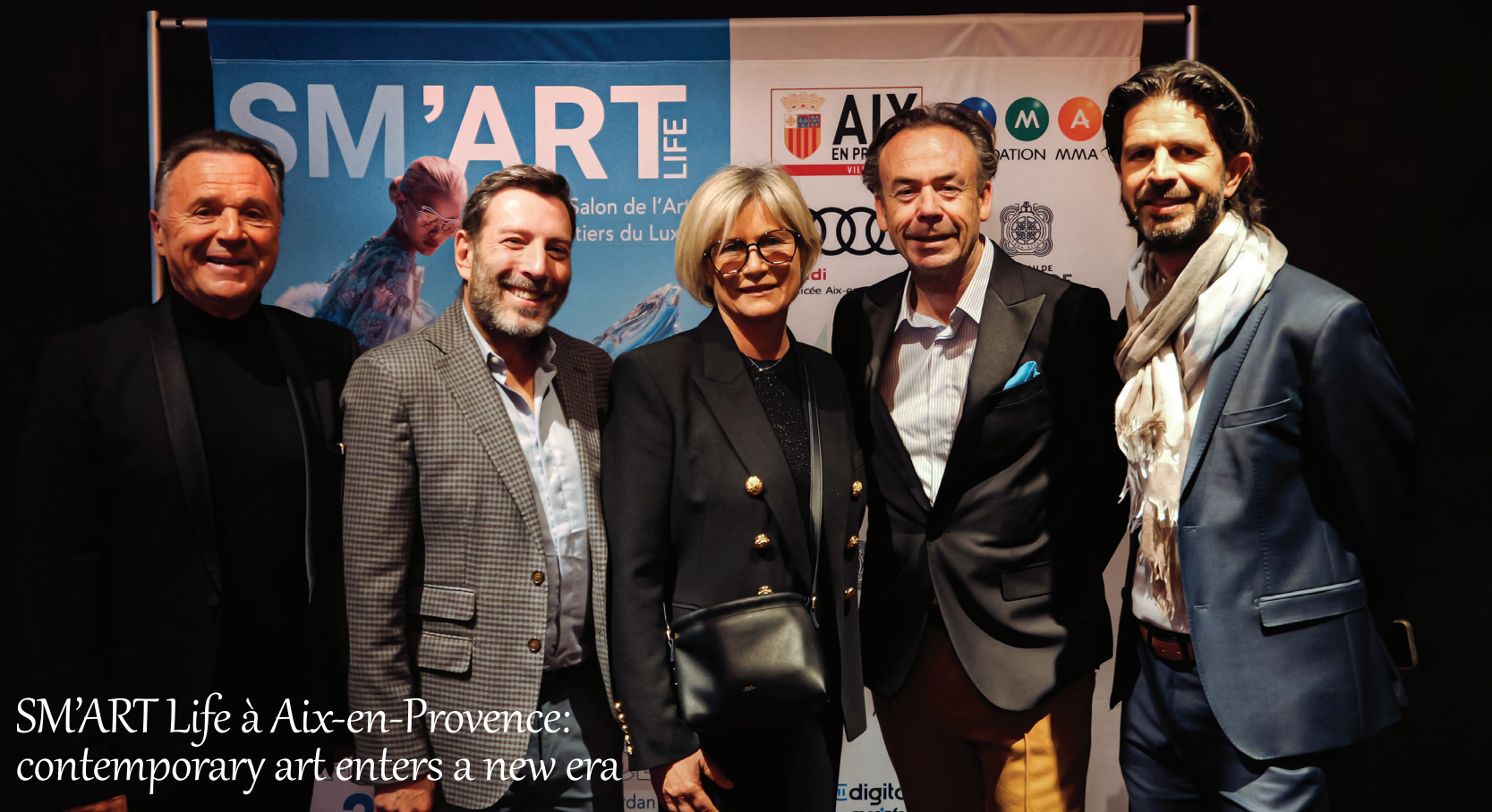
SMART Life à Aix-en-Provence: contemporary art enters a new era