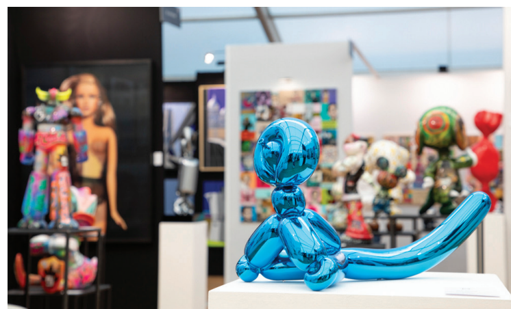
A fresh drive for a historic fair

The twentieth edition signifies a genuine renaissance for Sm'Art. Renamed SM'ART Life, the fair presents a new vision that extends beyond the traditional scope of the contemporary art fair. Its aim is to foster a dialogue between artists' works and the excellence of the luxury sectors – including haute couture, jewellery, art design, and the decorative arts of the table.