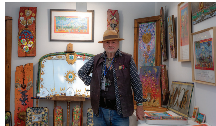
Collectors, buyers, and the curious

This orientation reflects a simple belief: artist and artisan share the same relationship with material, the same precision of gesture, and the same pursuit of aesthetic emotion. By bringing these worlds together, SM'ART Life aims to offer the public a more expansive cultural experience, grounded in material engagement, while situating the fair within a distinctly international dimension.